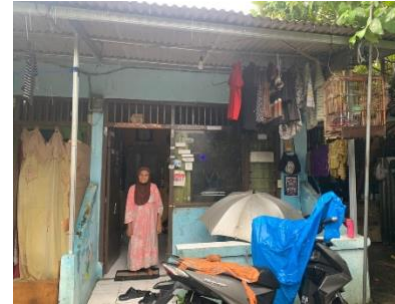
Gambar 3. Tampak Depan Rumah Ibu Risma Sirait