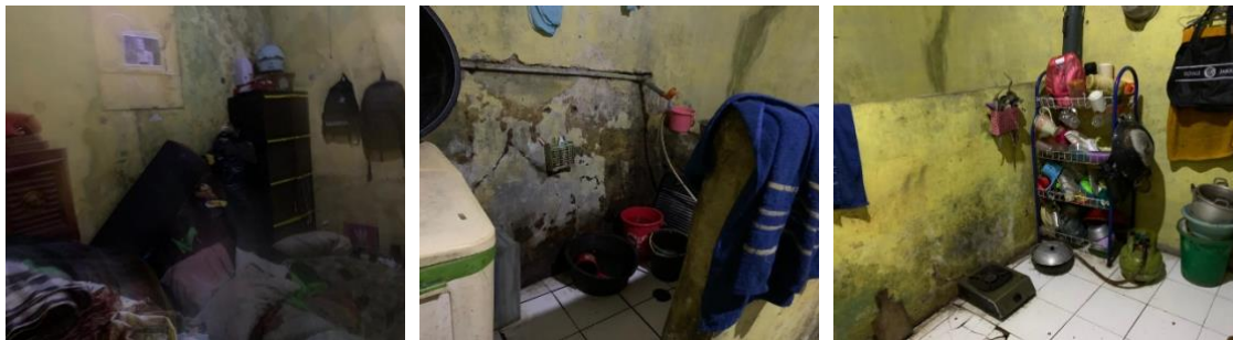
Gambar 4. Kondisi Rumah Ibu Risma Sirait

Informasi tersebut diperkuat melalui koordinasi dengan Ketua RT setempat guna memastikan keabsahan data dan kelayakan keluarga sebagai penerima bantuan. Tahap pencarian informasi ini menjadi dasar penting dalam memastikan bahwa kegiatan pemberdayaan dilakukan secara tepat sasaran dan sesuai dengan kebutuhan riil masyarakat.