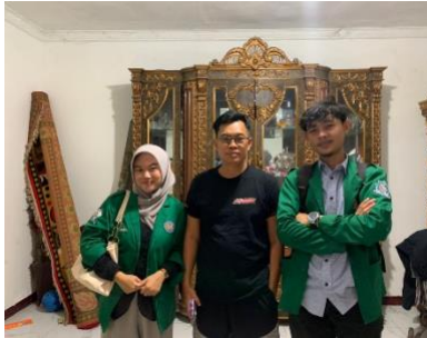
Gambar 1. Koordinasi Dengan Ketua RT

mengalami disabilitas dan gangguan kesehatan mental, sehingga menambah beban ekonomi dan sosial keluarga.