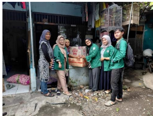
Gambar 6. Distribusi Bantuan

Secara keseluruhan, hasil kegiatan ini sejalan dengan nilai-nilai Islam dan semangat Al-Ma'un yang menjadi dasar gerakan sosial Muhammadiyah, yaitu keberpihakan terhadap kaum lemah dan upaya nyata dalam mewujudkan keadilan sosial melalui tindakan langsung di tengah masyarakat.