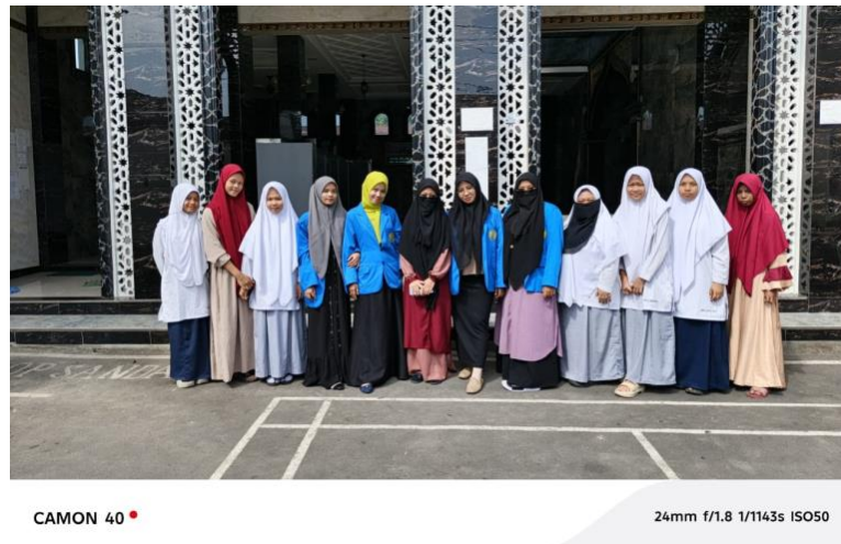
Gambar 2. Dokumentasi Peneliti bersama para Santri (Anak).

Tidak hanya itu, anak juga menjadi lebih peka terhadap kondisi sosial. Salah satu responden menceritakan bahwa anaknya menyumbangkan sebagian uang jajan untuk kegiatan sosial sekolah karena merasa tersentuh setelah menghafal ayat-ayat tentang infak dan sedekah. Perilaku seperti ini menunjukkan bahwa hafalan Al-Qur'an telah terinternalisasi menjadi nilai moral yang berpengaruh terhadap perilaku prososial anak.